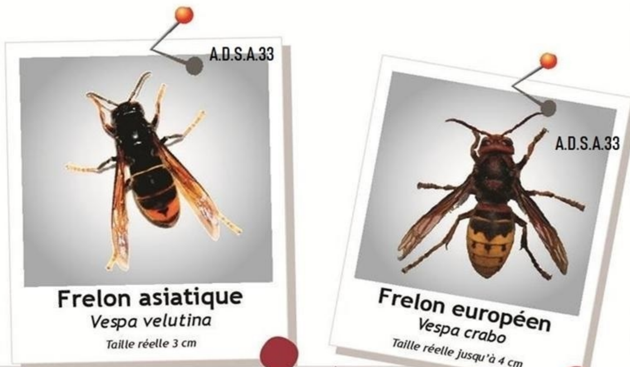
Frelon asiatique Vespa velutina Taille réelle 3 cm