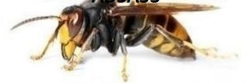
Association pour la Défense et la Sauvegarde des Abeilles."ADSA33"