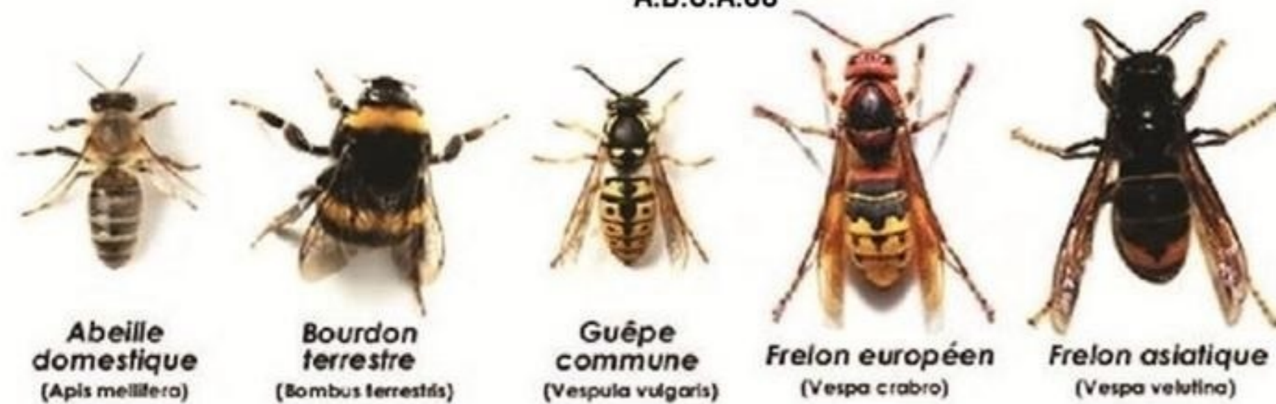
Abeille domestique ( Apis mellifera )